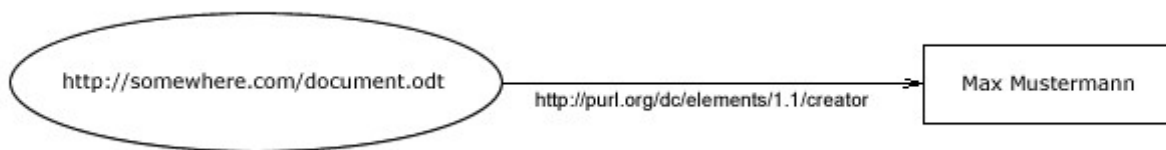
Abbildung 2: Graph eines RDF Tripels

Der typische RDF-Ausdruck besteht aus einem RDF-Triple (s. Abb. 2). Die Drei Elemente sind Subjekt, Prädikat und Objekt – vergleichbar mit einem einfachen Satz. Die Elemente des Tripels stellen ein Subjekt (zum Beispiel ein Dokument oder eine Person) in einer bestimmten Relation ("wurde verfasst von", "ist Autor von", "ist verheiratet mit") zu einem Objekt (z.B. einer Webseite oder einer anderen Person).